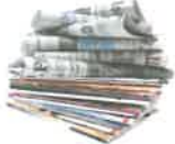
JOURNAUX ET MAGAZINES