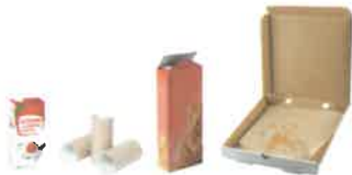
EMBALLAGES EN PAPIER ET CARTON