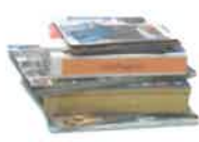
PROSPECTUS ET CATALOGUES