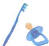
OBJETS EN PLASTIQUE